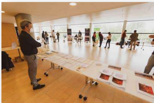
Zona de Ventas Decorö 2021