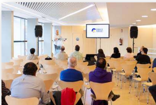
Zona para la exposición y área de presentaciones