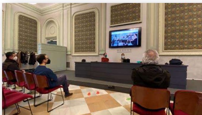
Presentación en línea durante la II edición de Decorö (2020)