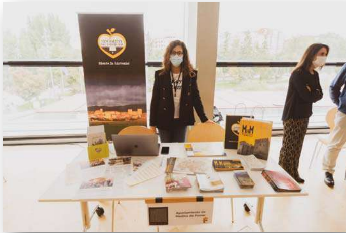
Expositores de la III edición de Decorö (2021)