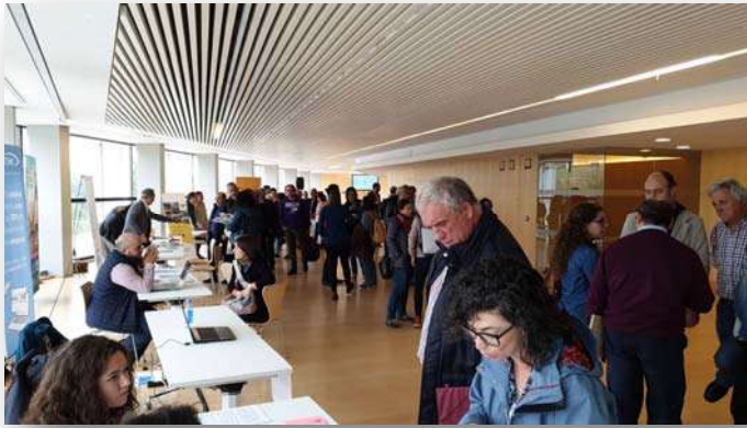
Visitantes de la I edición de Decorö (2019)