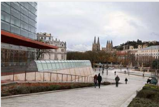
La ciudad de Burgos vista desde el Fórum Evolución

Parada indispensable en la ruta del Camino de Santiago, Burgos es uno de los principales destinos turísticos de España, con un amplio conjunto monumental y alberga en su entorno dos lugares declarados Patrimonio de la Humanidad por la UNESCO (Catedral de Santa María y Yacimiento de Atapuerca).